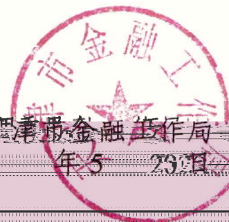
天津市金融工作局