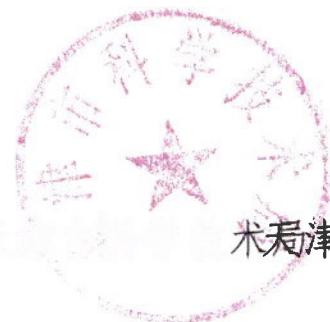
天津市科学技术局