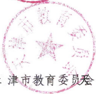
天津市教育委员会