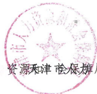
天津市人力资源和社会保障局